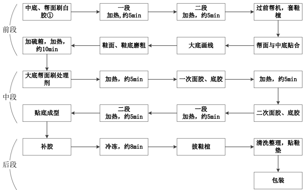
图 2 贴底成型工艺流程图

备注：①中底、帮面刷白胶：少数企业直接涂刷 PU 胶，大多企业采用白胶。某些运动鞋不需要在中底、帮面刷白胶，而是通过针车直接将中底和帮面缝制在一起。