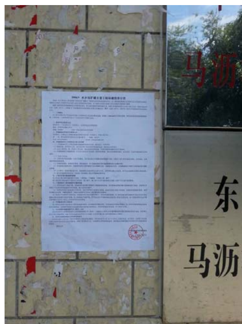
马沥村张贴环境信息公告