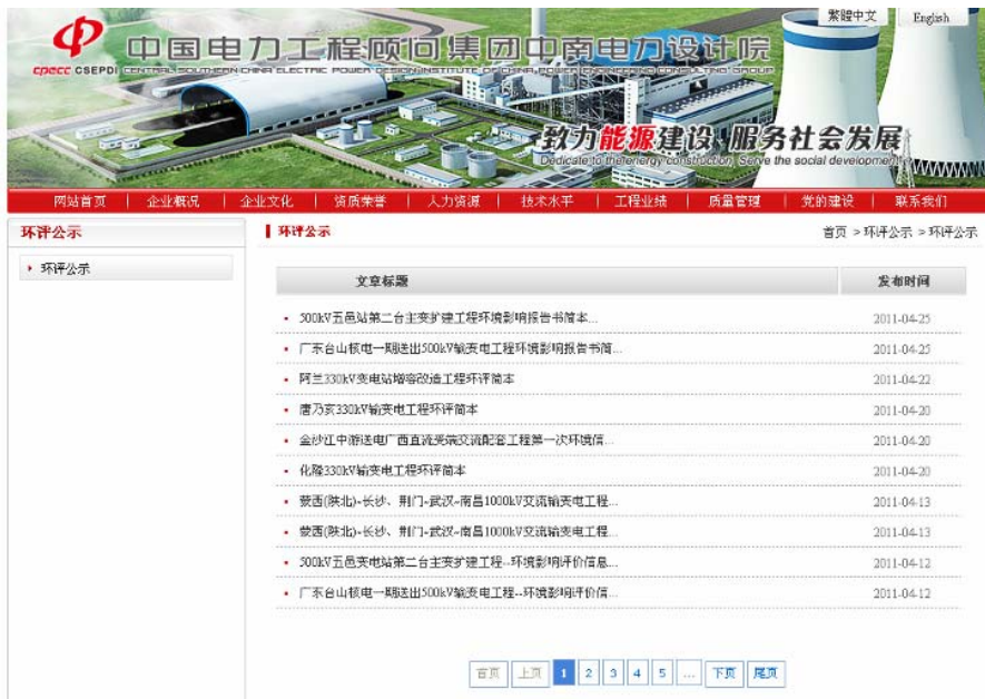
第二步：进入环评公示版块