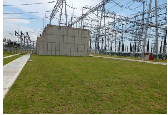
#4 主变压器扩建场地