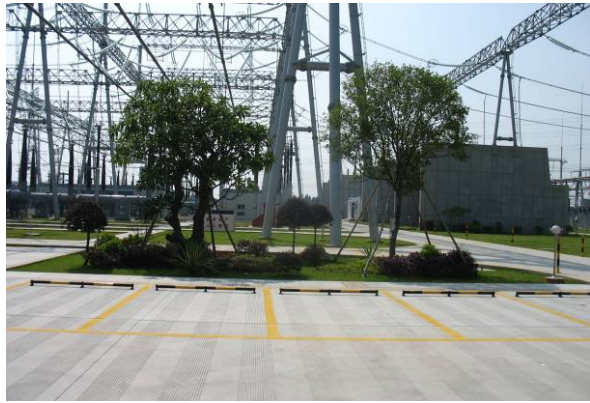
变电站主控楼前绿化