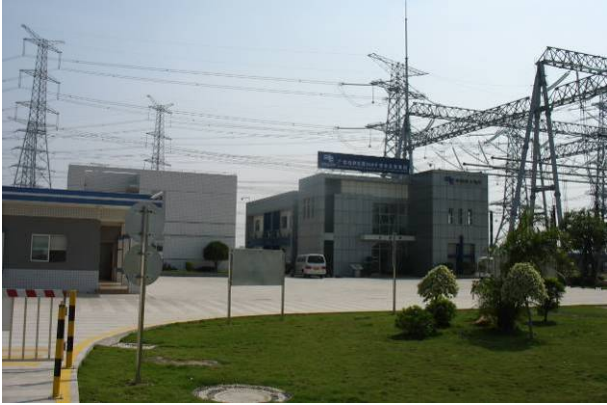
水乡 500kV 变电站主控楼