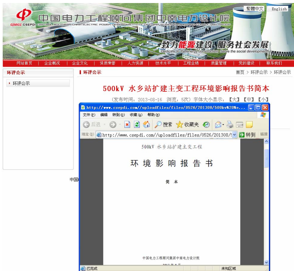
第三步：进入本工程环境影响报告书简本 图 10-3 网上公开环境影响报告书简本