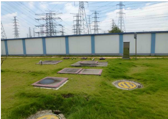
地埋式污水处理装置