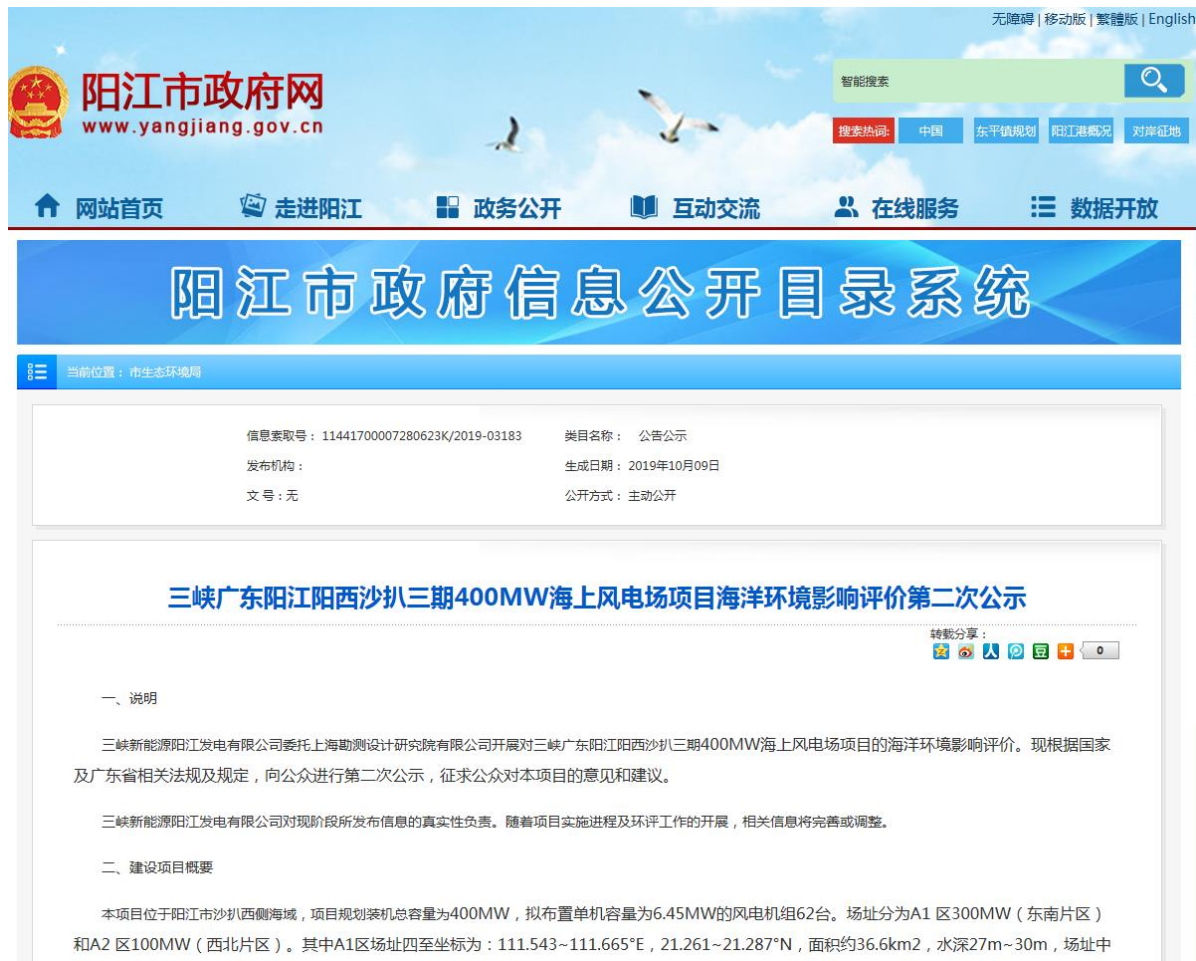
图 3-1 第二次网络公示