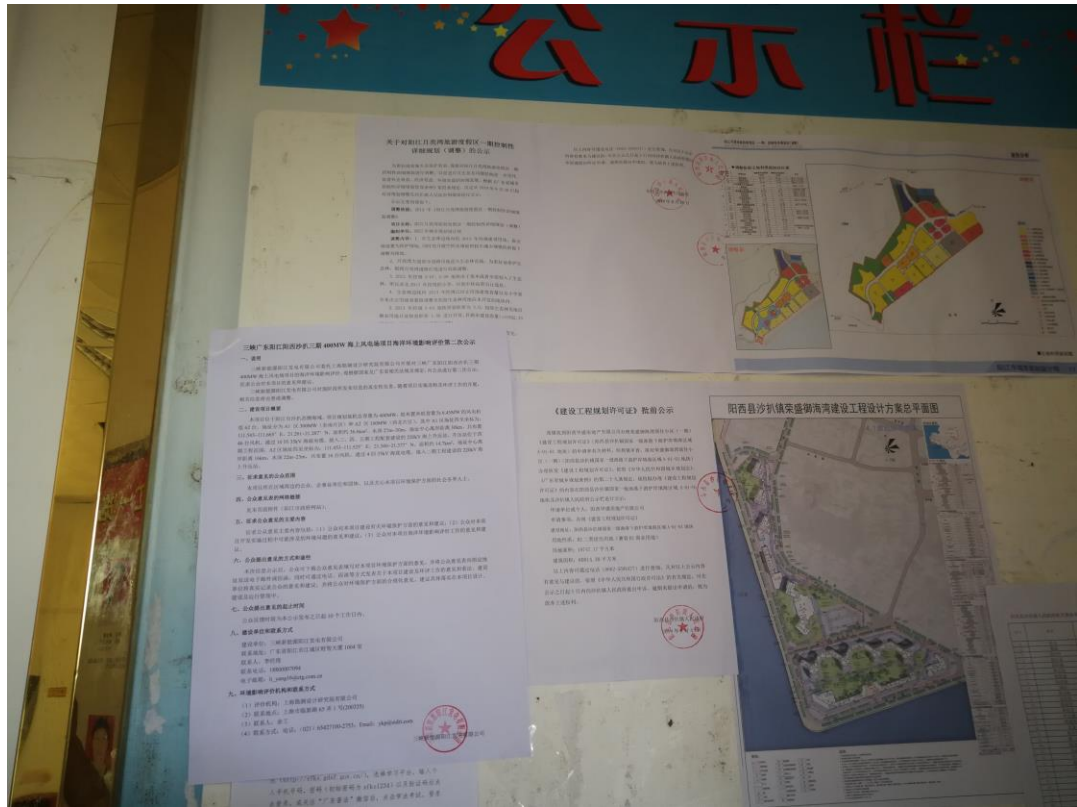
图 3-3 现场张贴公示照片 1

本次公告在距工程最近的沙扒镇、上洋镇公告栏张贴，该区域可基本覆盖工程敏感区域人群，且公众容易到达和阅读，便于知悉项目信息内容。