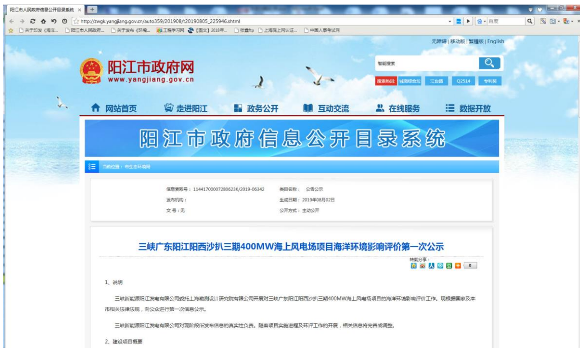
图 0-1 首次网络公示

首次环境影响评价信息公示依托网络平台开展，通过阳江市政府网（ http://www.yangjiang.gov.cn/ ）发布公示信息，公示时间为 2019 年 8 月 2 日，（网络截图见图 2-1）。首次环境影响评价信息公示的网络载体、公示时间均符合相关要求。