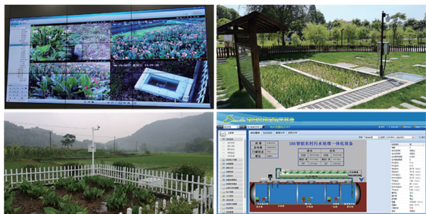
图 2 部分企业运维平台及在线视频监控现场