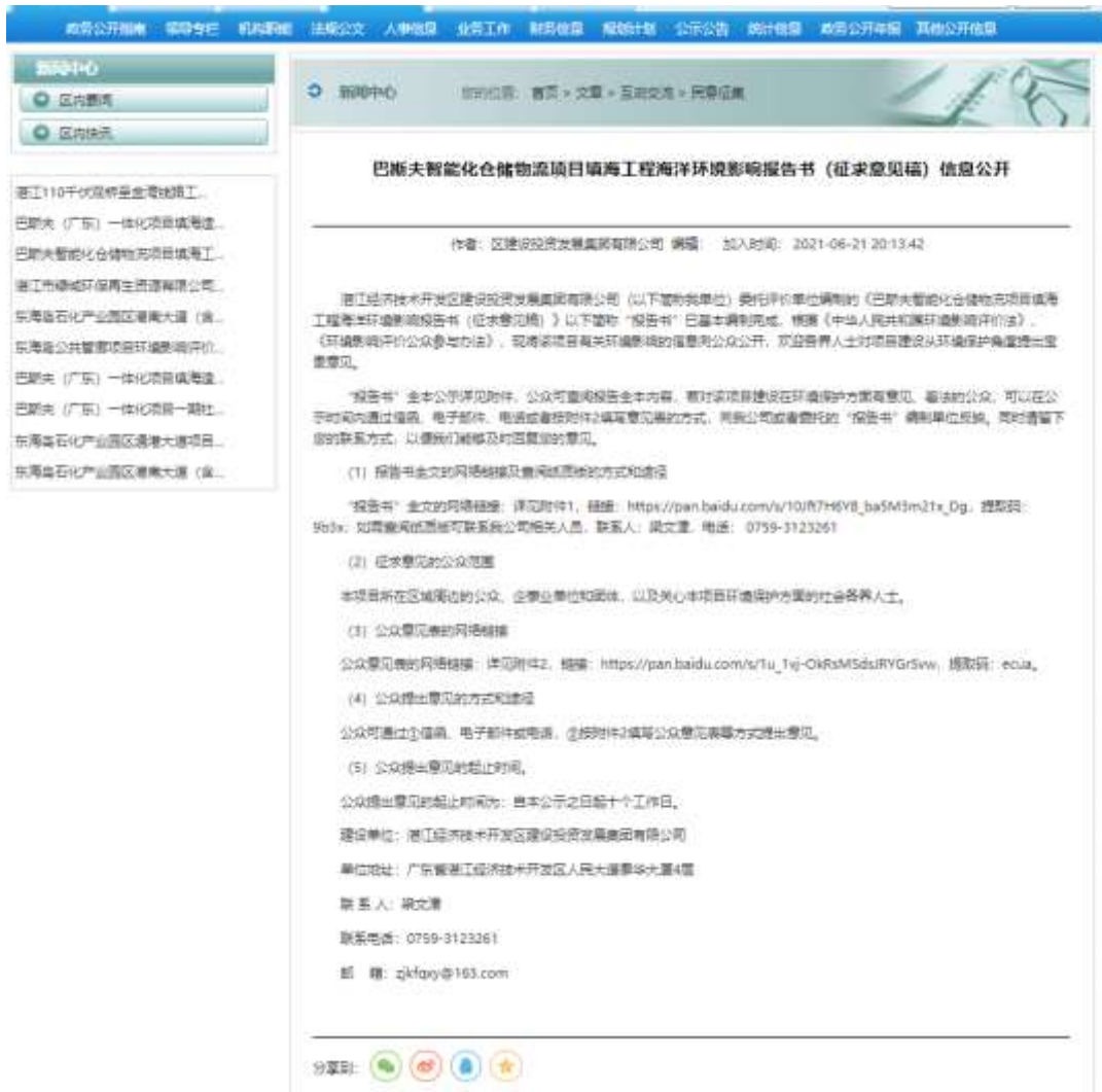
图 3.2-1 征求意见稿网上公示截图