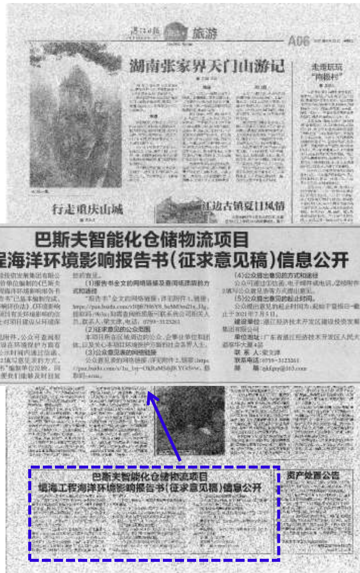
图 3.2-2 征求意见稿公示报纸公示照片