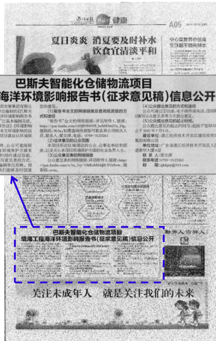
图 3.2-3 征求意见稿公示报纸公示照片