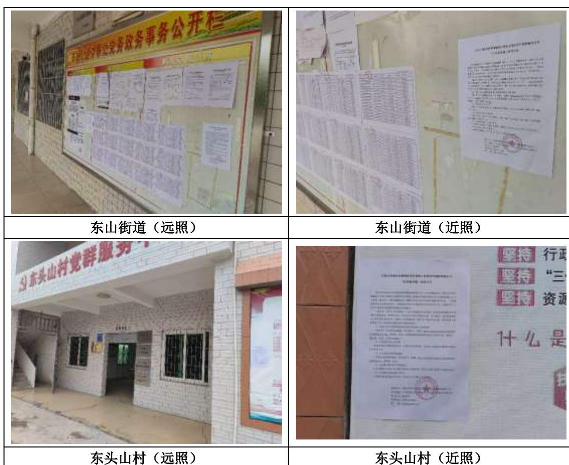
图 3.2-4 征求意见稿现场张贴照片