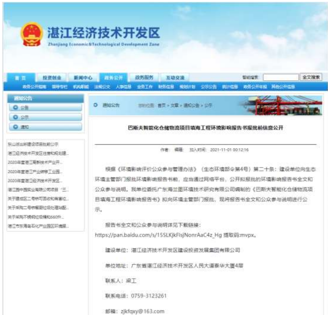
图 6.2-1 报批前网络公示截图