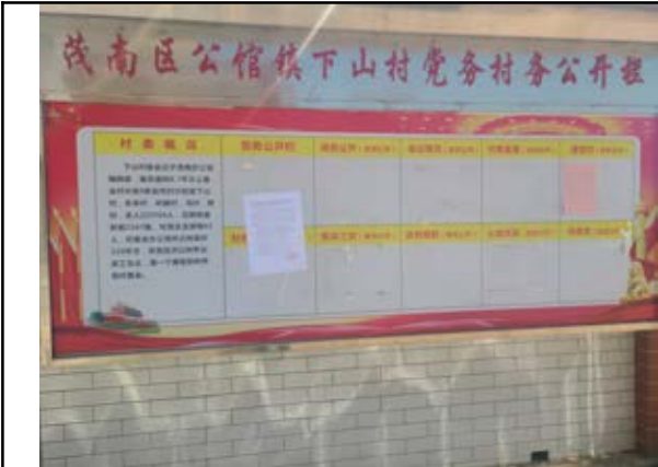
公馆镇下山村委（远）