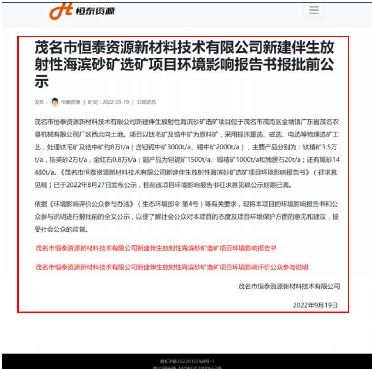
图 5.1-1 建设单位网站报批前全文本公示截图（第三次公示）

项目建设单位在向生态环境部门报批环境影响报告书之前，于 2022 年 9 月 19 日在建设网站（ http://maominghengtai.com/ ）公开拟报批的环境影响报告书全文和公众参与说明，截图见图 5.1-1，符合《环境影响评价公众参与办法》要求。