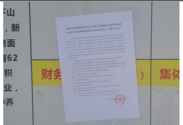
公馆镇下山村委（近）