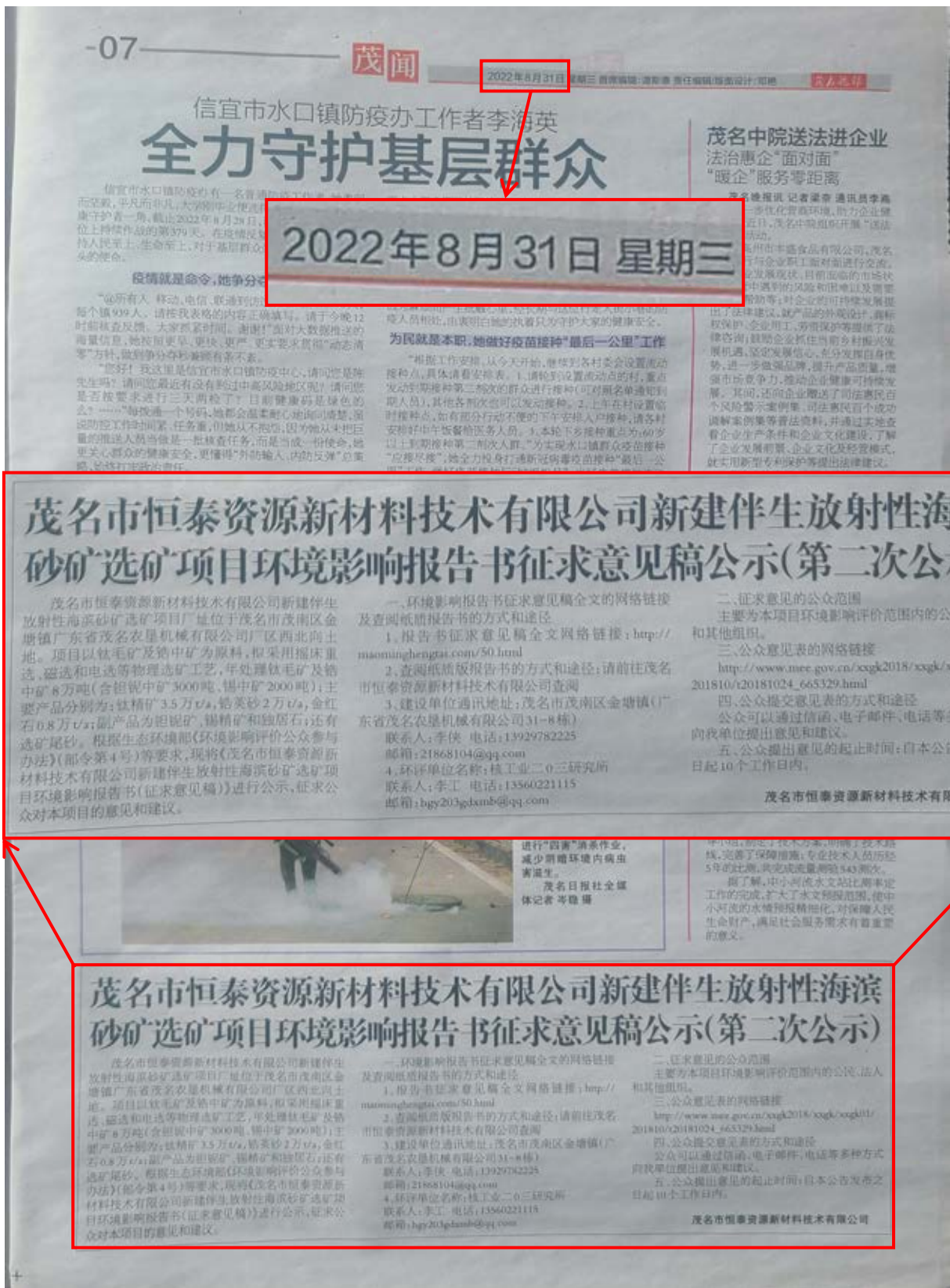
图 3.2-3 茂名晚报公示图（2022 年 8 月 31 日第二次登报）

载体选取的符合性分析：新建项目位于茂名市茂南区金塘镇广东省茂名农垦机械有限公司厂区西北向土地，其征求意见稿公示方式采用当地公众易于接触的报纸公开，且