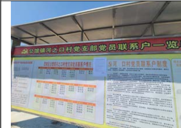
公馆镇可之口村委（远）