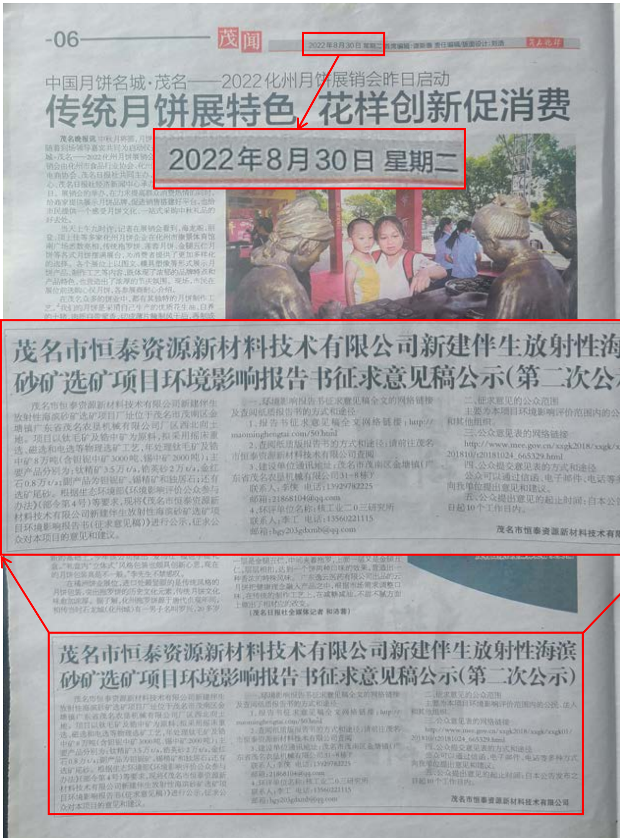
图 3.2-2 茂名晚报公示图（2022 年 8 月 30 日第一次登报）