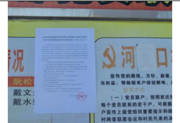
公馆镇可之口村委（近）