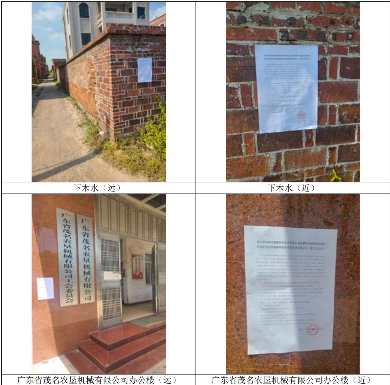
图 3.2-4 项目周边镇政府、行政村和村小组现场张贴公示图

张贴区域选取的符合性分析：本项目征求意见稿公示选取本项目及周边居民点：在金塘镇政府、公馆镇政府，塘桥村委、丰田村委、上垌村委、锡塘村委、谭屋村委、金塘社区居委，公馆镇下山村委、公馆镇可之口村委，上木水村、高魁村、下木水村，广东省茂名农垦机械有限公司办公楼等等地进行现场张贴公示，并自公示公告发布起连续公示 10 个工作日，符合《环境影响评价公众参与办法》要求：通过在建设项目所在地公众易于知悉的场所张贴公告。