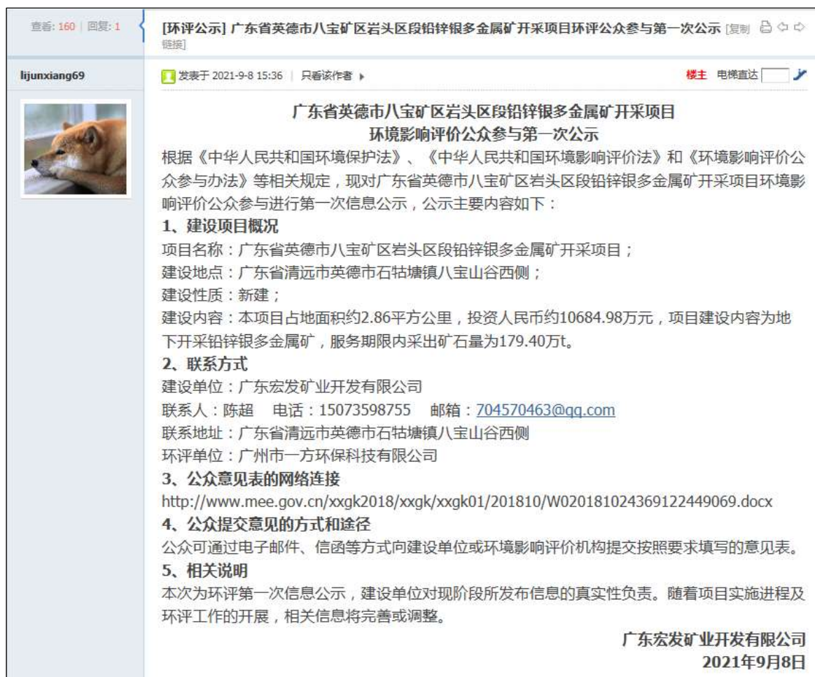
图 4.1-1 首次环境影响评价信息网上公开截图