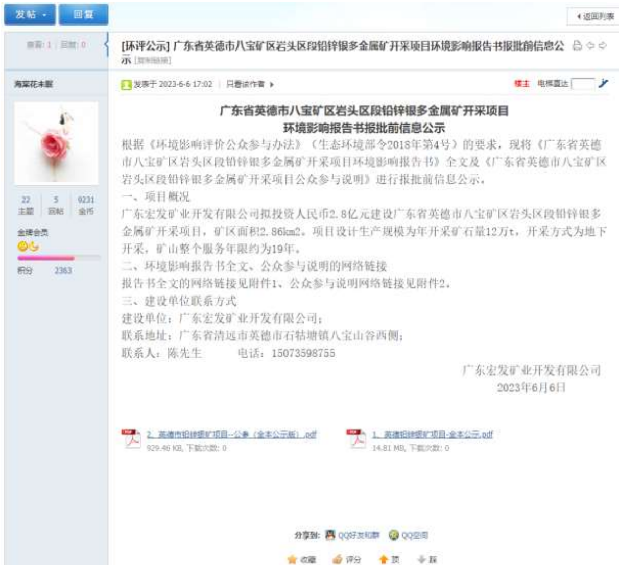
图 7.1-1 全本公示截图