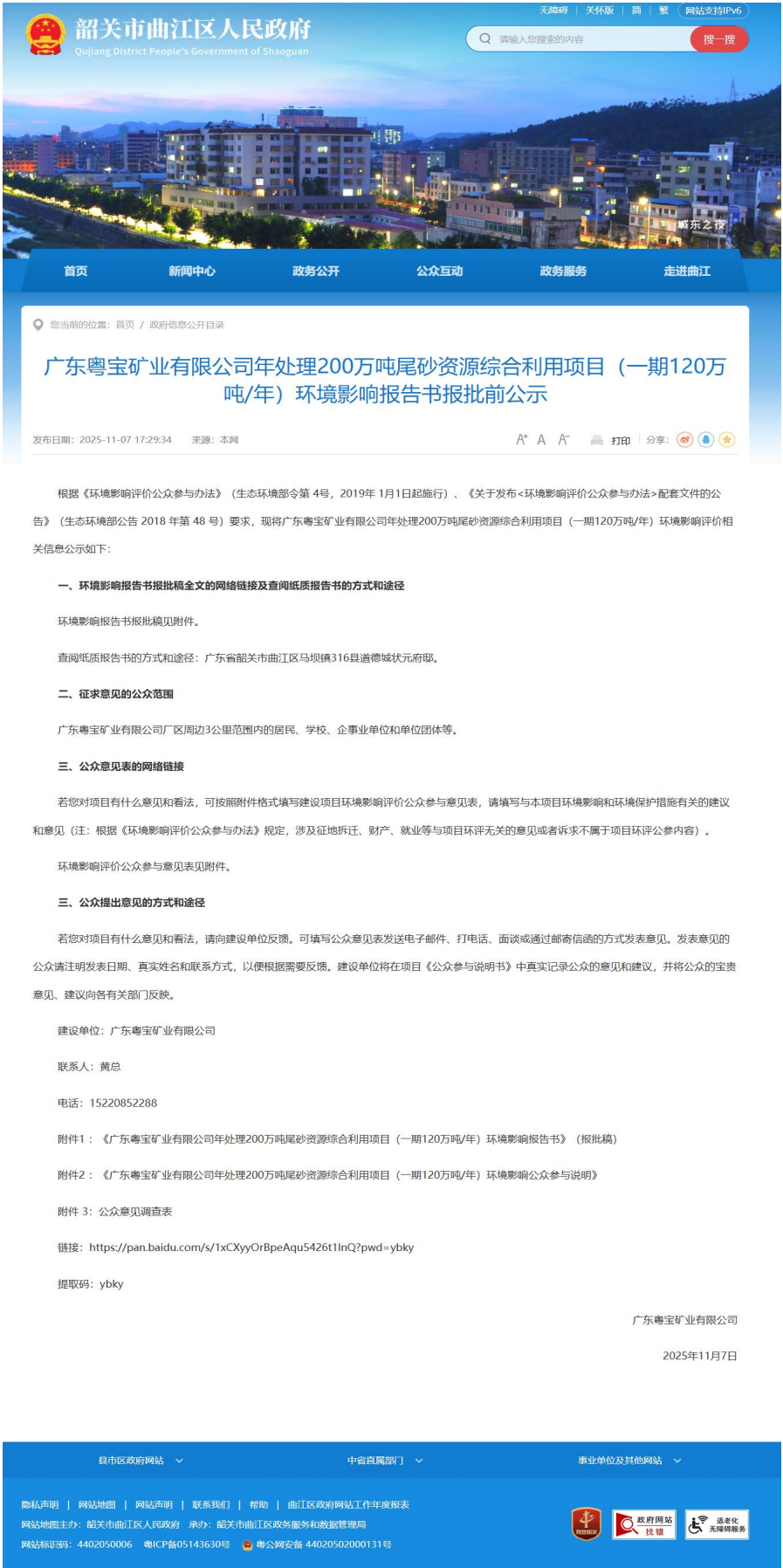
图 6.2-1 报批前公示截图