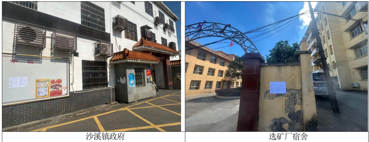
图 3-2 公众参与第二次现场公示图片