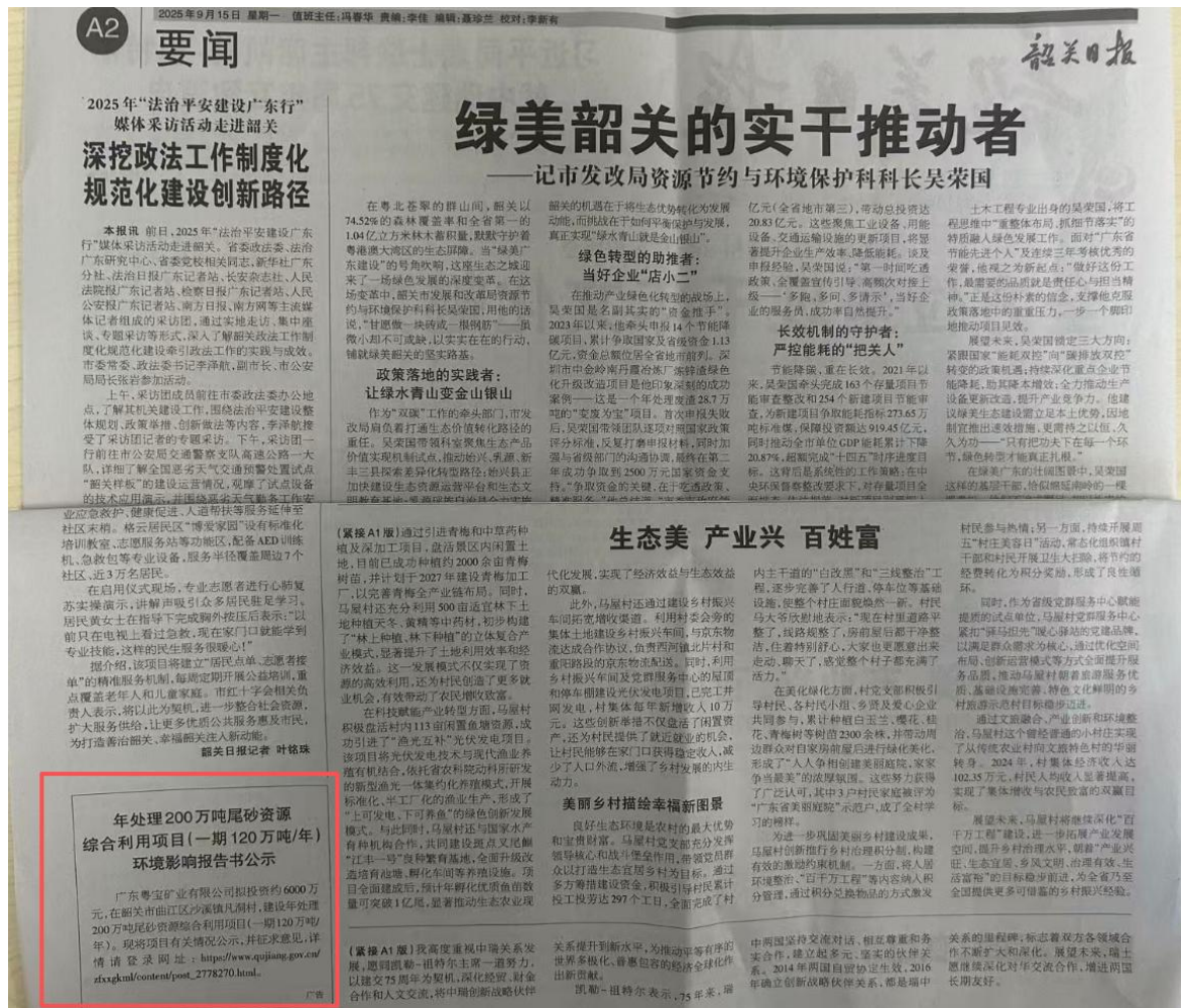
图 3-4 第二次报纸公示截图