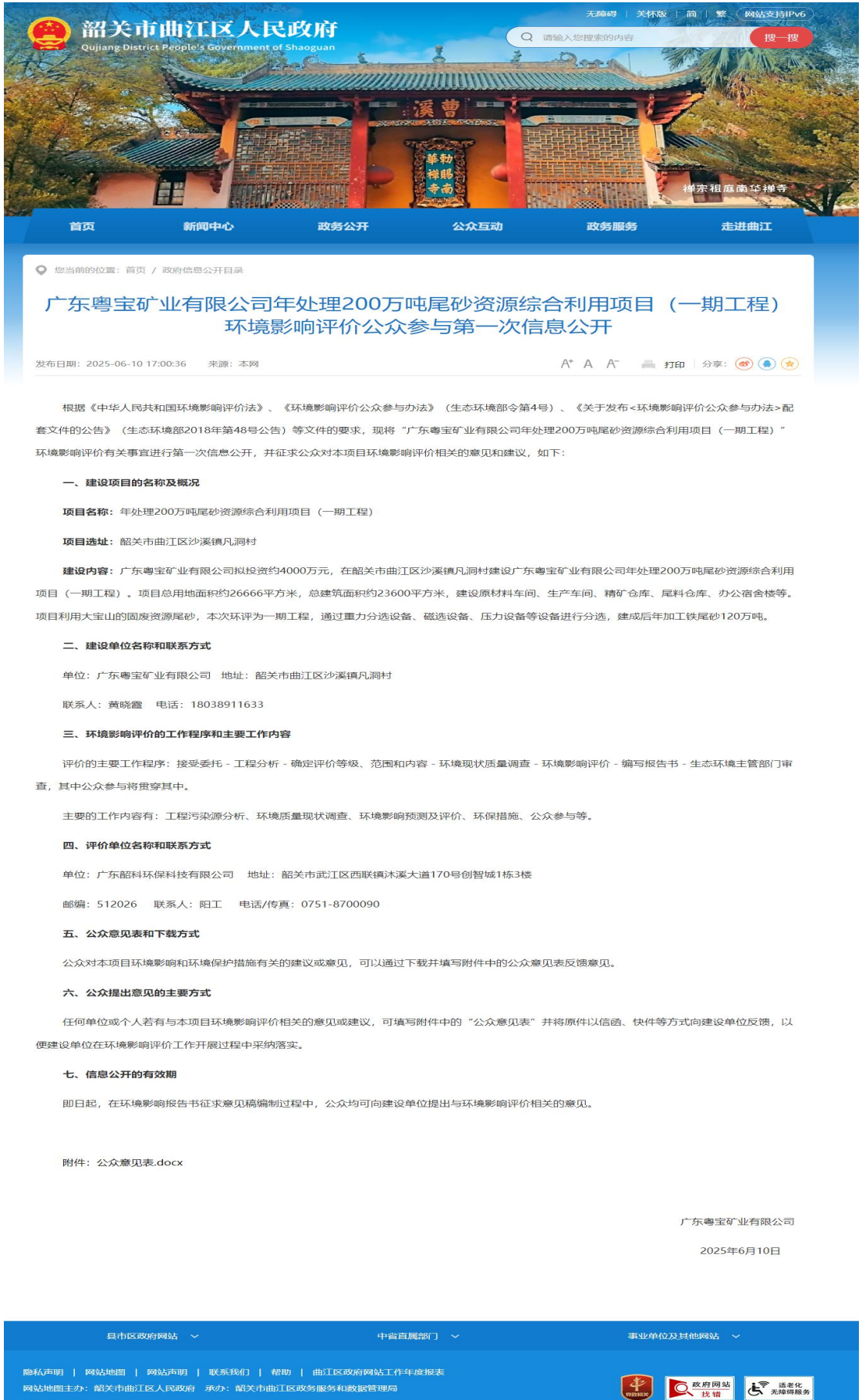
图 2-1 第一次信息公示网上截图