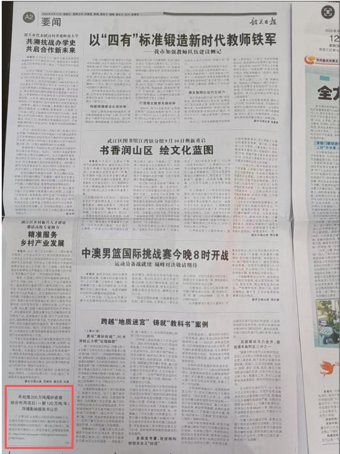
图 3-3 第一次报纸公示截图